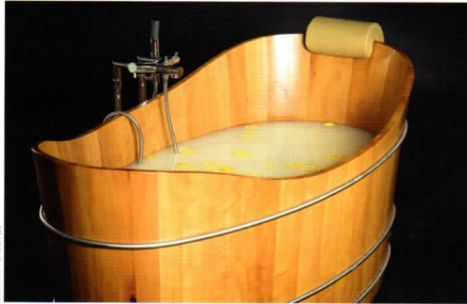
Badewannen aus Holz sind leicht zu pflegen und halten viele Jahrzehnte.

B adewannen aus Holz verfügen über eine Vielzahl positiver Eigenschaften. Holz ist ein erstklassiger Dämmstoff und trägt dazu bei, dass das Badewasser lange seine gewünschte Temperatur behält. Im Vergleich zu Badewannen aus Kunststoff oder Metall fühlt sich Holz auch unter Wasser angenehm sanft an. Schmutzränder sind kein Problem, an der geölten Oberflä-